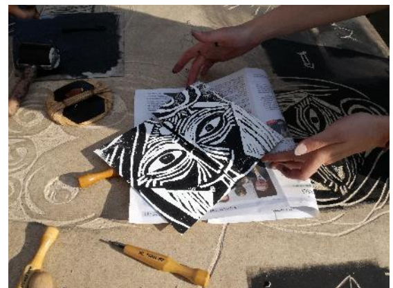
Fotos: Holzschnittworkshop von living rooms bei Oskar nimmt Platz 2018

Wir danken Bürgermeister Karl Harrer, der sich für Nachhaltigkeit in der Stadtgemeinde durch das „Plastikfreie Gemeinde“-Projekt einsetzt, für die Unterstützung und die Getränke!